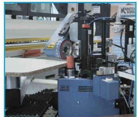
Formteil wird verarbeitet