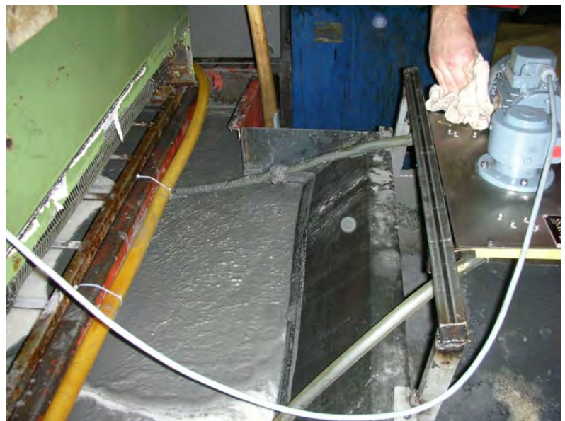
Ölskimmer Modell W40 an Kühlschmierstoffbehälter