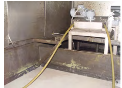
Ölskimmer Modell W40 für Abwasseraufbereitung