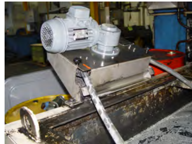
Ölskimmer Modell W40 an Emulsionsanlage