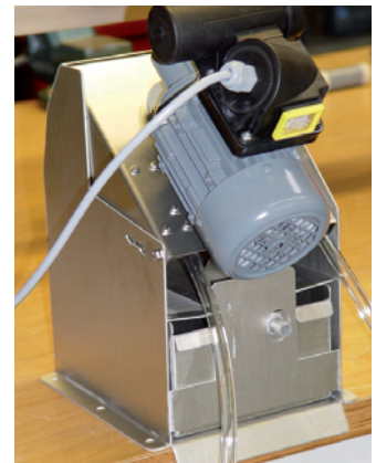
Modell 1U mit eingebaut. Abscheidetank