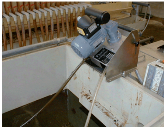
Öl Skimmer Modell 1U an Abwasseraufbereitungsanlage