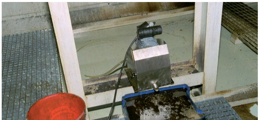
Öl Skimmer Modell 1U an Emulsionsbehälter