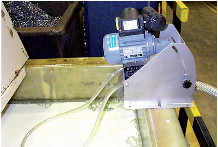
Öl Skimmer Modell 1U an Emulsionsbehälter

Der Öl Skimmer Modell 1U ist speziell für den Dauerbetrieb im rauen industriellen Umfeld konzipiert. Ölaufangwanne und Grundkörper bestehen aus rostfreiem Edelstahl. Das Antriebsrad ist mit hochabriebfester Keramik bestückt und garantiert daher hohe Standzeiten und eine lange Nutzungsdauer auch bei stark verunreinigten Kühlschmierstoffen und Entfettungsbädern. Da der Neigungswinkel des Öl Skimmers beliebig einstellbar ist, kann das Gerät an die Verhältnisse am Einsatzort optimal angepasst werden. Der Öl Skimmer wird serienmäßig mit Schalter, Kabel und Stecker ausgeliefert und ist sofort betriebsbereit. Bei der tragbaren Version ist eine zusätzliche Haltevorrichtung im Lieferumfang enthalten. Damit ist der flexible Einsatz in verschiedenen Becken gewährleistet.