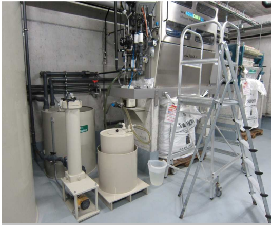
Mobile Tuchspülstation wird bei Bedarf einfach mit dem Hubwagen zum AF Filterautomaten gebracht und mittels Schnellkupplungen angeschlossen. Die „Dialog“ Steuerung regelt die Umwälzpumpe und führt den Betreiber durch alle Tätigkeiten und Schritte während des Spülens durch Klartextanzeige und Quittierfunktion.