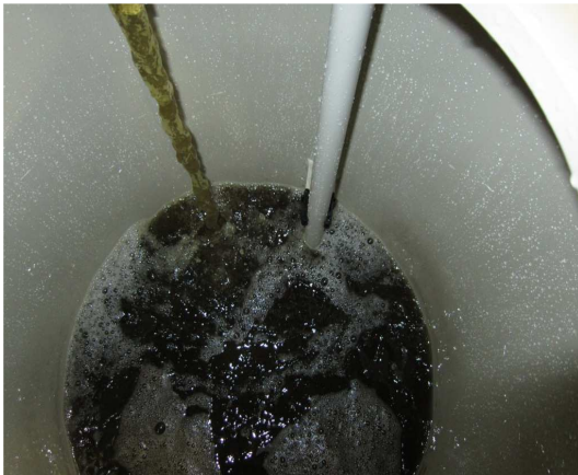
Volumen für jeweilige Größe des Filterautomaten ausgelegt. Durch Kreislaufführung kann das Reinigungsmedium wiederverwendet werden und wird bei Bedarf nur nachgeschärft. Optional mit Injektorpumpe für Ansatz und separater Umwälzpumpe falls Beschickungspumpe aus Beständigkeitsgründen nicht geeignet ist.