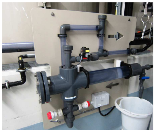
Standard Trübungswächter für die Filtratleitung mit Entlüftungsstrecke. Ungewünschte Trübungen die gegebenenfalls nachfolgende Einrichtungen belasten können oder generell stören werden erkannt und zur Vorlage zurückgeführt. Je nach Anwendung wird gegebenenfalls ein Alarm oder eine Meldung ausgelöst.