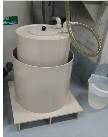
Spülstation mit Sicherheitsmantel, komplett aus Polypropylen, geeignet zum Verfahren mit Hubwagen.