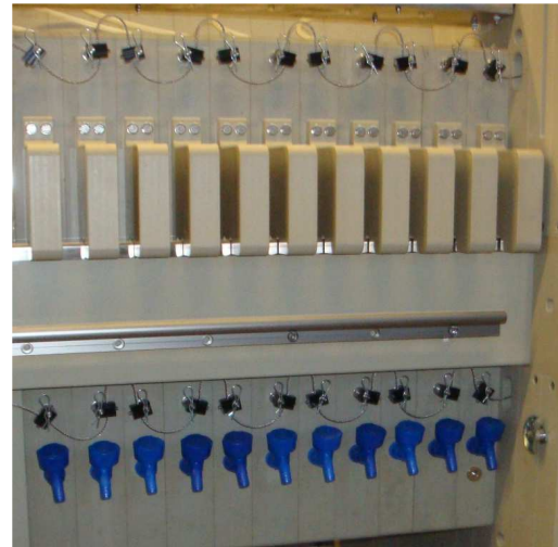
Durch abgedichtete Ausführung wird das Spülmedium leakagefrei in geschlossenem System geführt und verursacht keine Korrosion oder Gefährdung von Mitarbeitern.